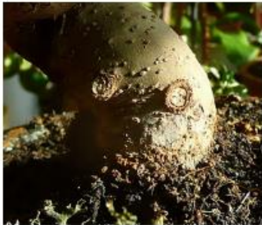
Palikti šakų "velneliai"

Pirmausia, ką reikia padaryti kai medis jau adaptavosi prie naujų sąlygų, tai iškarpyti sausas šakeles, patikrinti žaizdas. Įdėmiai reikia apžiūrėti ir medžio kamieną bei šakas. Medelynuose prieš teikiant medelius rinkai ne visada kokybiškai nuimamos naudotos formavimui vielos. Dažnai naudojamos ir ne profesionalios aliumininės ar varinės vielos, bet paprastos plieninės, kurios rūdija, įsivėžia į bonso žievę ir labai kenkia tolimesniam jo augimui. Tokias vielas reikia nedelsiant pašalinti, o žaizdas patepti žaizdų tepalu. Nesvarbu, kokios šis tepalas rūšies. Svarbu izoliuoti žaizdą. Lauko bonsams tai prevencija nuo infekcijos, žaizdos permirkimo ar perdžiūvimo, kambariniams – nuo perdžiūvimo. Užteptos žaizdos gyja greičiau.